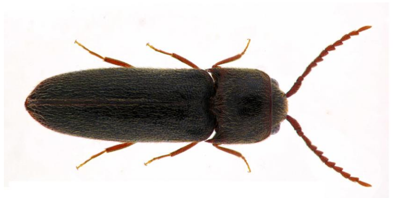
© R. CHAMBORD / SEL 2009 échelle : 1mm