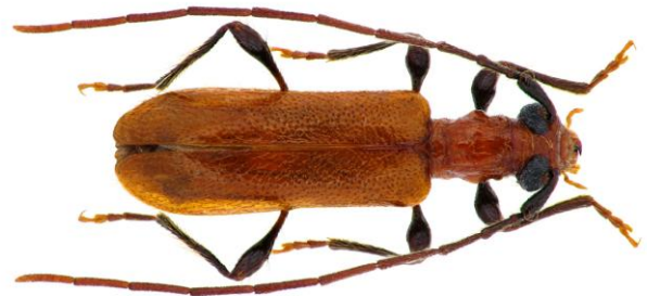
© R. CHAMBORD / SEL 2009 échelle : 1mm