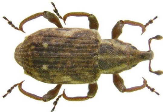
échelle : 1mm