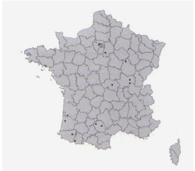
Figure 2 : Distribution française de Microrhagus pyrenaeus , d'après Brustel & Van Meer (2008).