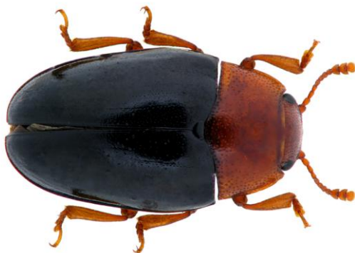
échelle : 1mm